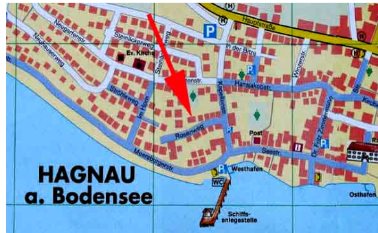
• Haus Rosengarten im Rosenweg 12 ↓↓