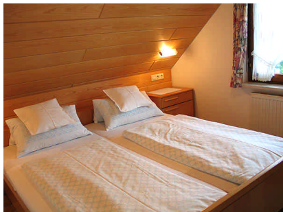
Wohn- und Schlafzimmer Wohnung Pfänder