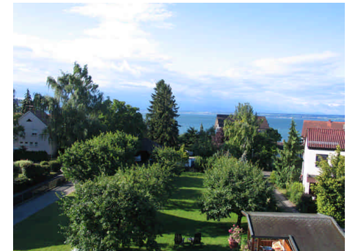
Blick über den Garten auf den Bodensee

Die Ferienwohnungen für zwei bis drei Personen sind geschmackvoll und komfortabel eingerichtet, mit getrennten Wohn- und Schlafräumen, Dusche/WC, Radio, SAT-TV, Telefon und überdachtem Südbalkon mit Seesicht. Unser gepflegtes Haus steht in einem großen Garten, abseits vom Verkehr in einer Sackgasse, in ruhiger und zentraler Lage. Zum Schiffsanleger sind es nur 250m, zur Ortsmitte 500m. Unser Haus hat in allen vier Wohnungen Parkettböden und bietet auch Allergikern einen angenehmen Wohnkomfort. Auch unsere Dachgeschoßwohnungen bleiben an heißen Sommertagen angenehm kühl. Unsere Ferienwohnungen sind rauchfreie Zonen, darum bitten wir, im Haus nicht zu rauchen. Wir sind sicher, daß Sie sich bei uns wohlfühlen und erholsame Urlaubstage genießen werden. Bei klaren Wetterlagen besteht Fernsicht zu den Bergen der Schweiz, der Säntis ist gewaltig zu sehen.